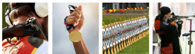
Bogensport – Trainingsmöglichkeiten in der Praxis für den Breitensport